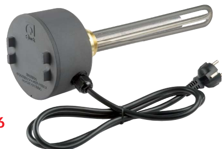
Protezione antideflagrante. / Anti-flare protection