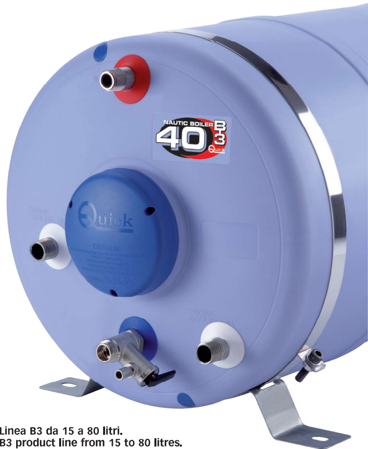
Linea B3 da 15 a 80 litri. B3 product line from 15 to 80 litres.